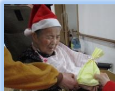
12/25(土) クリスマス会 写真

あけましておめでとうございます。旧年中はご家族の皆様より沢山のご支援ご協力を賜り、厚く御礼申し上げます。今年ことはコロナ禍が終息し、入居者の皆様とご家族様が一緒に過ごす時間を取り戻せることを願うばかりです。本年もこれまで同様のご愛顧を賜りますようお願い申し上げます。